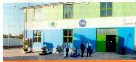
A BAUER Hungária Kft. új alkatrészraktára

Az elméleti előadásokon túl, egy gyakorlati gépkiallítást is megtekintettek a résztvevők, ahol láthatták a BAUER Rainstar típusú öntözőgépet. AS 50 típusú öntözőkonzollal, a BAUER gyártmányú hígtrágya szeparátort, különféle hígtrágya szivattyúkat és a hígtrágya keverőket, valamint a BRU nevű tehenészeti alomregeneráló berendezést. A szakmai rendezvény a látottak és elhangzottak értékelésével zárult.