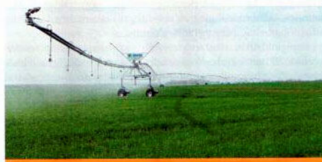
BAUER Centerstar+Corner karos öntözőgép

Ha az arányokat nézzük abból egyértelműen kiderül, hogy bőven lenne lehetőség és szükség az öntözés fejlesztésére. Ahhoz, hogy a növekedés felgyorsulhasson, több állami feladat is adódik, például a területek rendezése, víztározók létrehozása, megfelelő jogi háttér kialakítása stb., amit meg kell, meg kellene oldani. A BAUER cég világszínvonalú öntözőgépeivel a következő években is felkészülten várja az aszály elleni küzdelmet. Számunkra rendkívül fontos a partnerek gyors és pontos kiszolgálása.