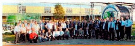
A szolnoki konferencia résztvevői